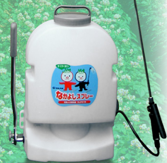
なかよしスプレー DLPC15への装着例